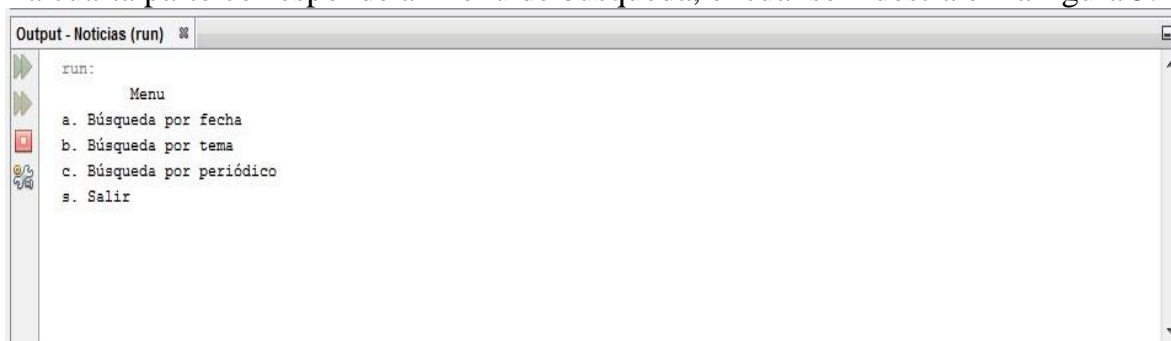
Figura 5. Menú de los archivos.

La cuarta parte corresponde al menú de búsqueda, el cual se muestra en la figura 5.