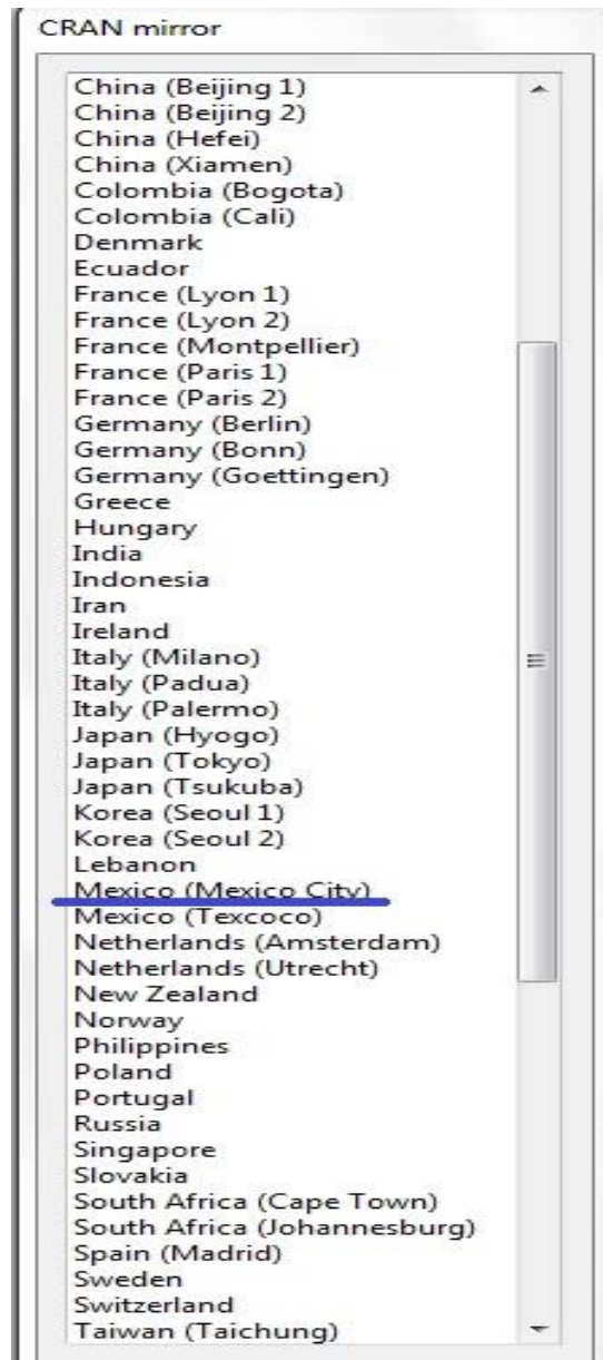
Figura 2. Posibles servidores para la descarga del paquete.

trying URL 'http://cran.itam.mx/bin/windows/contrib/3.0/cIValid_0.6-4.zip' Content type 'application/zip' length 487391 bytes (475 Kb) opened URL downloaded 475 Kb package 'cIValid' successfully unpacked and MD5 sums checked The downloaded binary packages are in Ruta 7